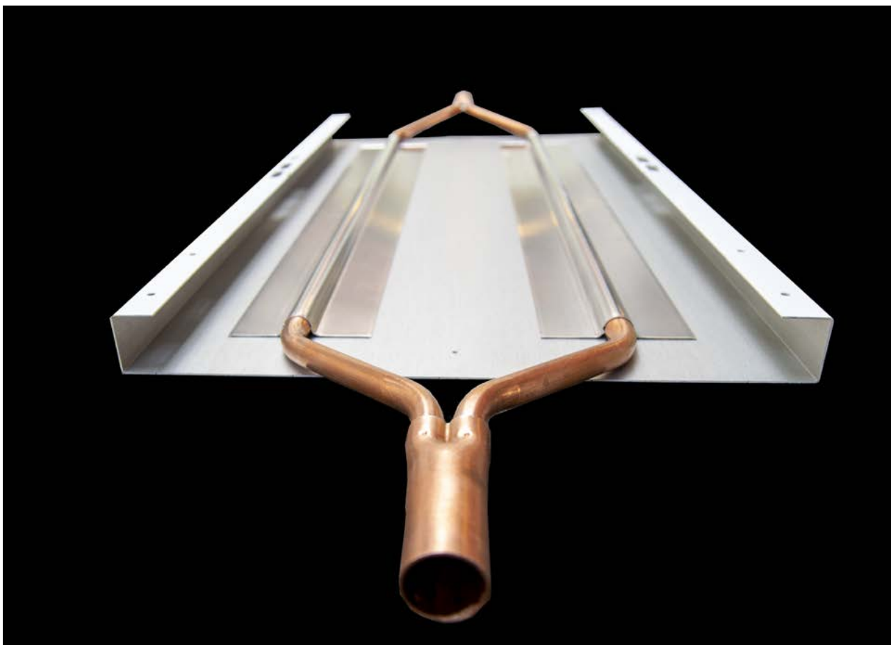
Heat med harpe register