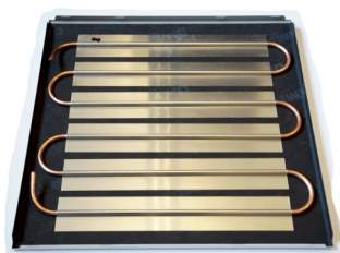
Figur 1: WLT-D klimaelement