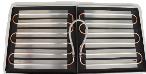
Figur 3: 2 stk. WLT-D mm elementer forbundet med fleksible forbindelse med lynkoblinger monteret på WLT-D elementes rørende. Bemærk fleksible slange må ikke være udstrakt.